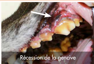
Récession de la gencive

Le tartre dentaire est, contrairement à ce que l'on pourrait penser, bien plus qu'un problème purement esthétique. Comment se forme-t-il, que doit-on savoir sur ses conséquences et comment y remédier ?